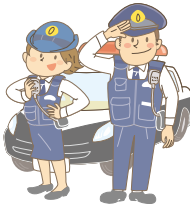
小郡警察署管内の犯罪・交通事故の発生状況 (令和2年11月末現在)

県内からの110番は、全て福岡県警察本部につながります。必要なことを質問しますので、落ち着いて、はっきり答えましょう。110通報と同時に、付近の警察署やパトカーに現場への急行を指示します。