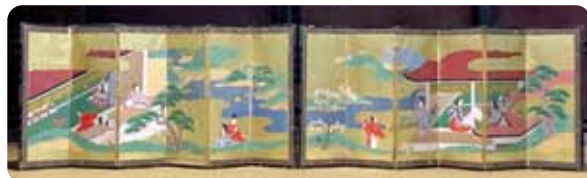
屏風一对(宮中物語絵巻)