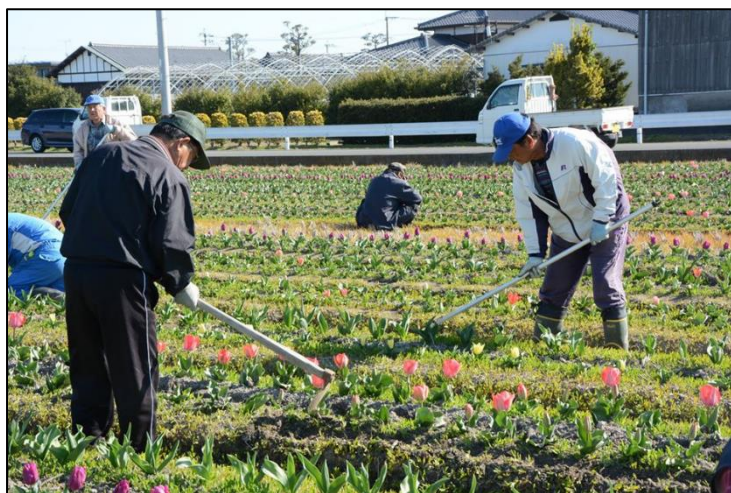
【資源向上(共同活動)の様子】