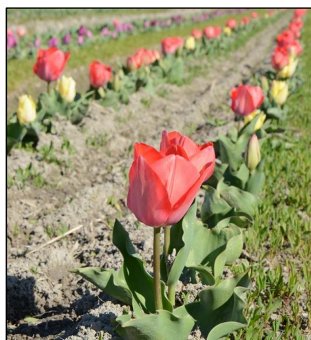
【光行チューリップ園】