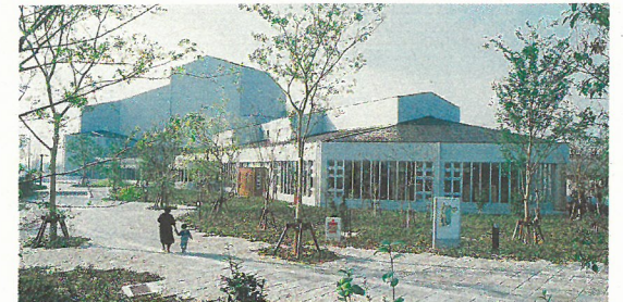
図書館・文化会館

総合保健福祉センター、生涯学習センター、図書館・文化会館、九州歴史資料館、陸上競技場・野球場、体育館