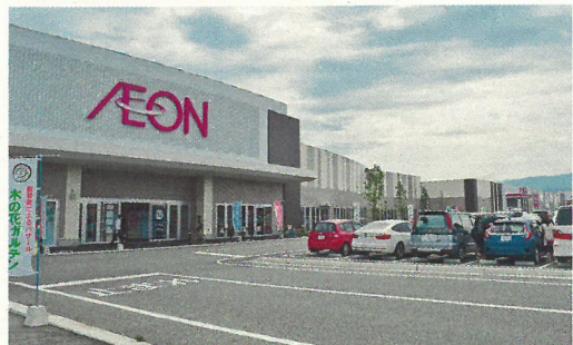
イオン小郡ショッピングセンター