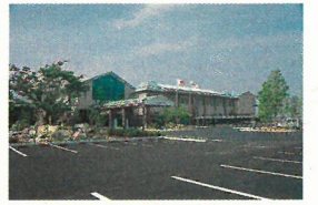
総合保健福祉センター「あすてらす」