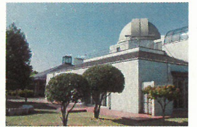
生涯学習センター