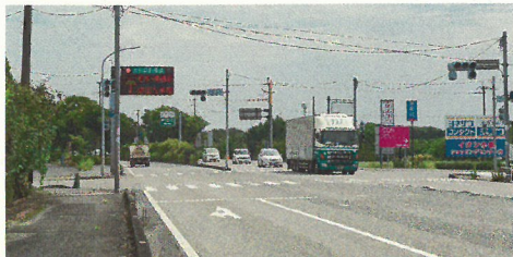
(主)久留米筑紫野線 (県道 53 号)