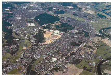
小郡・筑紫野ニュータウン