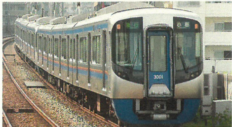
西鉄天神大牟田線