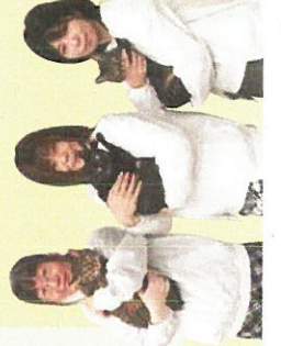
「さくらねこサポートOGORI」の皆さん

私たちは、不幸な猫がこれ以上増えないよう、猫に二代限りの命を全うしてもらうためTNR活動をしています。この活動は、(公財)どうぶつ基金をはじめ、全国各地で行われているものです。 猫と人が共生できるまちをつくりたいと考え、令和五年5月に団体を設立。市の市民提案型協働事業(※)に提案・採択されました。現在スタッフ約10人で、仕事の後や土・日曜を中心に活動しています。 野良猫は、交通事故や感寒症などの危険にさらされる過酷な環境で暮らしています。カラスに食べられたり、病気で死んでしまつたりする子猫の悲惨な状況をたくさん見てきました。皆さんにもその現状を知ってもらい、活動にご理解とご協力をいただければ幸いです。