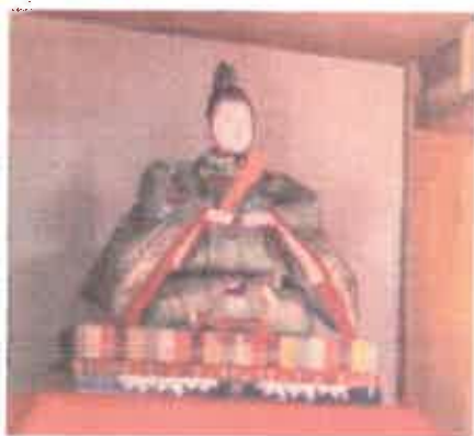
室町時代作の男雛