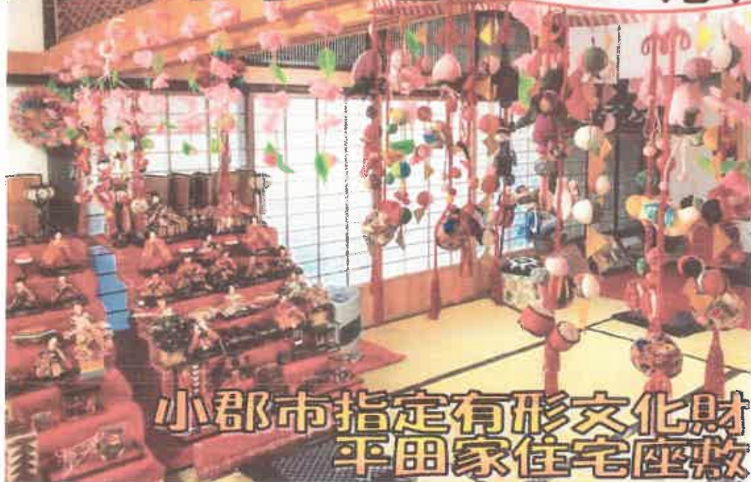
小郡市指定有形文化財 平田家住宅座敷