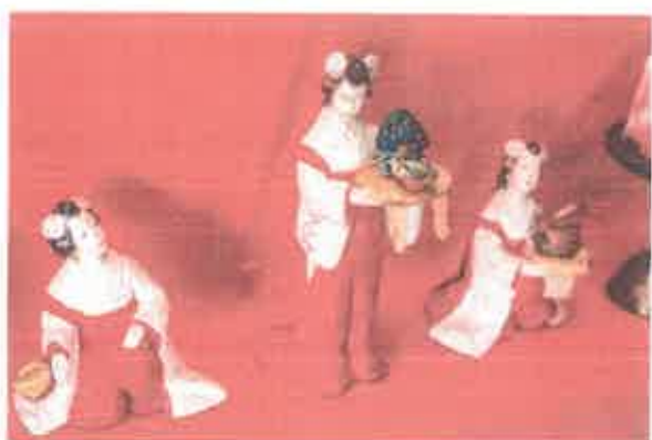
博多人形の三人官女