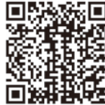
小郡警察署管内の犯罪・交通事故の発生状況 (令和2年1月未現在)