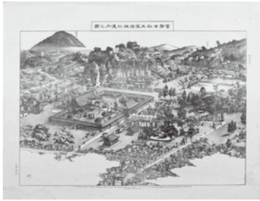
《官幣中社太宰府神社境内之図》 明治35年、九州歴史資料館所蔵

企画展「太宰府天満宮の境内絵図―さいふまいりの江戸・明治―」は、江戸時代から明治期にかけての太宰府天満宮の一枚刷り境内絵図の紹介や、太宰府の名所を描いた当時の絵画、版画を展示します。同時期の寺社絵図の中でも中核となる存在であった太宰府天満宮の境内絵図が、初めて一堂に会する貴重な機会です。