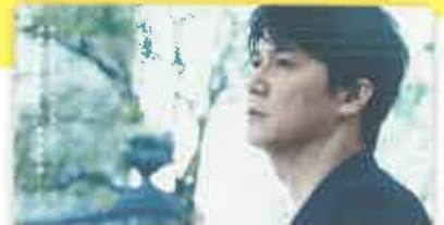
マチネの終わりに