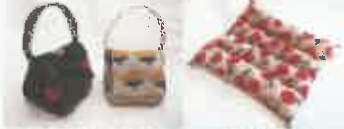
おにぎりホーチ 織製品まくら