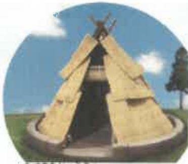
穴住居組み立て体験