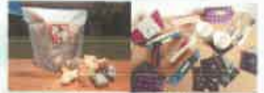
あられ 久留米餅の製品