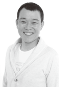
千原せいじ(千原兄弟)