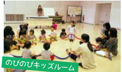
のびのびキッズルーム