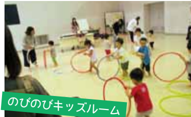
のびのびキッズルーム

小郡市子育て支援センターは、未就園のお子さんとその家族のために、さまざまな事業を行っています。