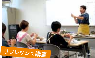
リフレッシュ講座