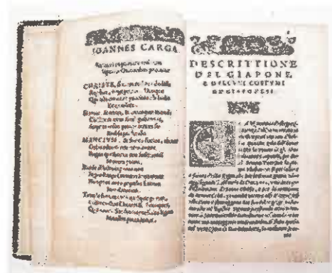
グワルチェリ「遣欧使者記(ヴェネチア版)」 (1586年)

日時 9月21日(土)～12月23日(月) 10時～18時(金曜日は20時まで)