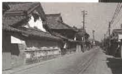
野田宇太郎の撮影した 往時の松崎の様子