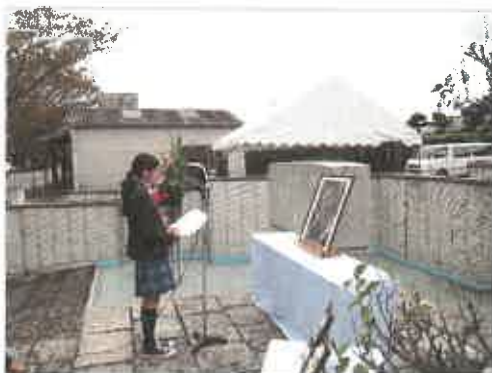
昨年度の捧詩の様子