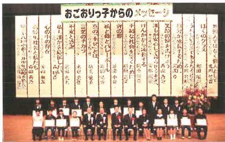
平成30年度 大会記念撮影

「おごおりっ子からのメッセージ」は、将来を担う子どもたちが、心身ともにたくましく、心豊かに成長できることを願い、平成4年度から開催されている青少年の主張大会。今年で開催27回目を迎えます。