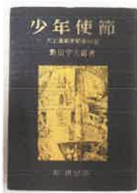
野田宇太郎『少年使節 天正遣欧使節旅行記』 (1949年 桐書房)

企画展では、野田が収集した貴重なキリシタン関連資料を中心に展示し、野田が文学的な視点でキリシタン史をどのように見ていたかを紹介しています。