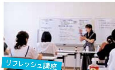
リフレッシュ講座