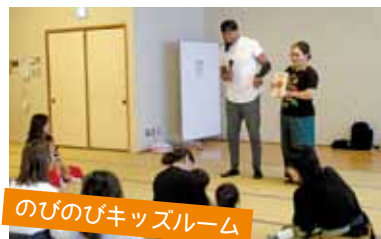
のびのびキッズルーム

小郡市子育て支援センターは、未就園のお子さんとその家族のために、さまざまな事業を行っています。