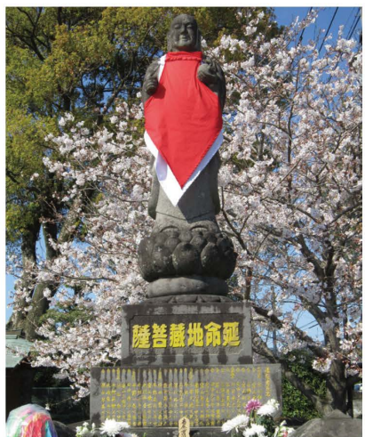
延命地蔵（一ツ木神社内）▶

学校近くの頓田の森へ避難しました。しかし、不運にも投下された爆弾の一発が児童31名の命を奪いました。1945年11月20日、一ツ木神社（現朝倉市）で延命地蔵の除幕式が行われました。一瞬にしてわが子を爆死という無残な姿で命を奪われた保護者の、二度と繰り返してはならない戦争への憤りであり、恒久平和を願ってやまない叫びです。