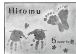
手足形パステルアート