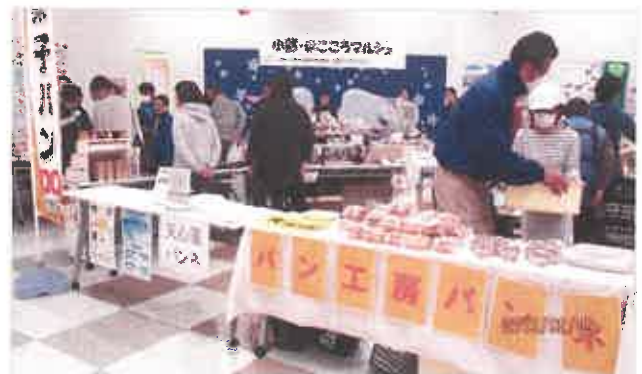
第1回（今年2月）の様子