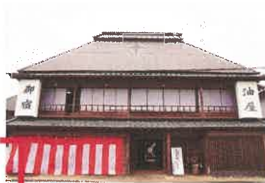
旧松崎旅籠油屋 (小郡市松崎)

申込方法 小郡学申込みと記載し、郵便番号・住所・氏名・電話番号を明記の上、FAX、メール又は電話にてお申し込みください。