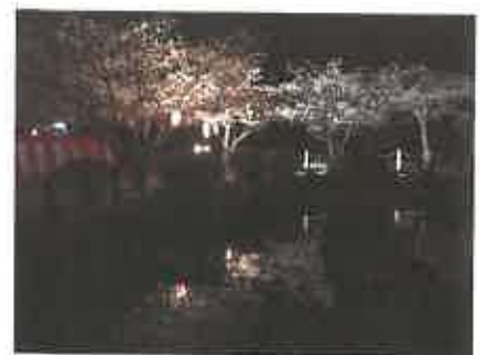
③御勢大霊石神社（夜桜）