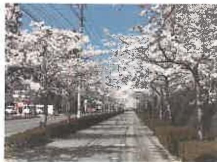
④小郡高校前桜ロード