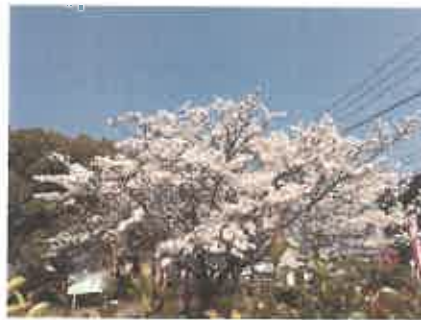
②東町公園（小郡市役所横）