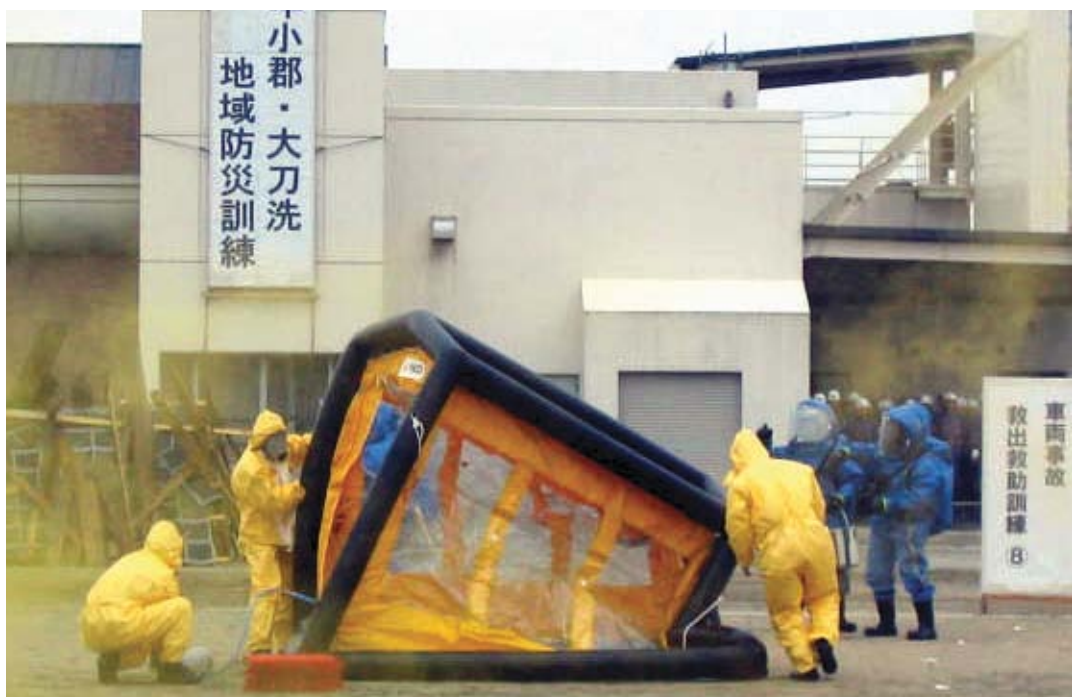
平成17年5月22日に開催された小郡・大刀洗地域防災訓練 (防護服を着用した訓練)