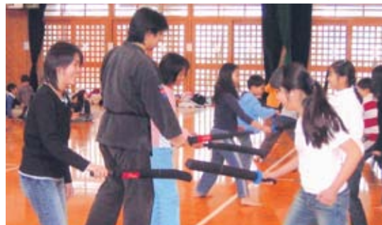
（スポーツチャンバラ風景）

今回は、市内のある地域の子ども会でのボランティアのみなさんの活動（スポーツチャンバラ：毎週水曜日、市体育館で活動）を紹介します。学習ボランティアガイドブックには、様々な種目が紹介されています。是非、ご覧になって皆さんの学習会・研修会・地域活動等に活かしてください。