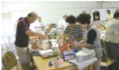
(手作りの作品づくり)