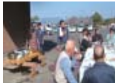
美味しいお昼ご飯！

また、今回の参加をきっかけに新たな人の輪が誕生しています。この年になって友達が増えるとは思わなかった。この声には拍手喝采でした。校区公民館を自分たちで守る・愛する！そんな情熱を肌で感じる立石校区です。