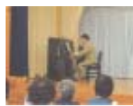
シャンソンに親しむ