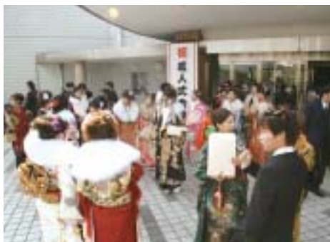
昨年度の式典会場の様子

市外に住居票があり、小郡市の成人式に参加する人は申込みをまだ済ませていない場合は、生涯学習課まで電話でお知らせください。 また、12月1日以降に小郡市に転入された対象者は、式典当日、直接受付までお越しください。 お願い 式典中は、携帯電話等の電源はお切りいただくかマナーモードをご利用ください。また、通話はお控えください。 申込・問い合わせ先 生涯学習課学習推進係(内線523) ファクス73522 2〒838 0142 大板井1180番地1生涯学習センター内)