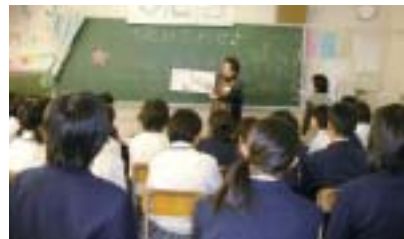
(立石中学校での読み聞かせ)