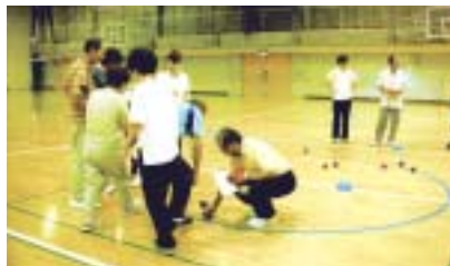
(ペタンクのルール習得中)