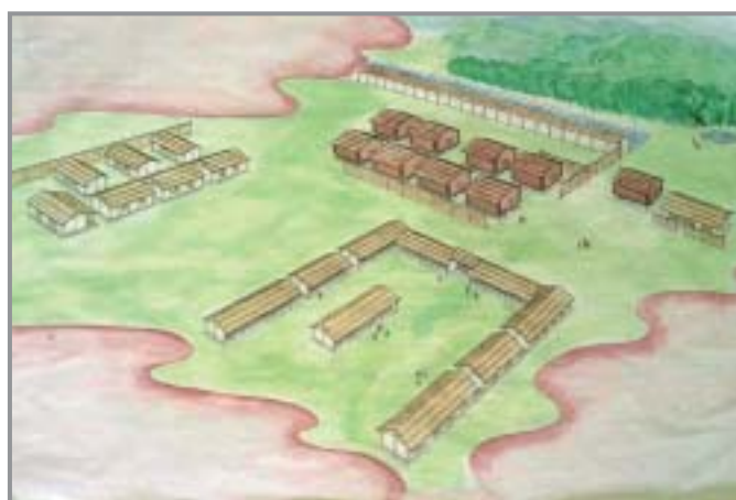
小郡官衙遺跡復元想像図