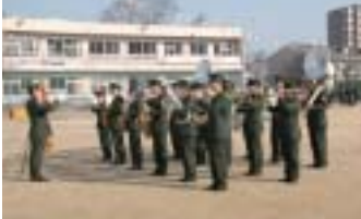
▲陸上自衛隊音楽隊の演奏