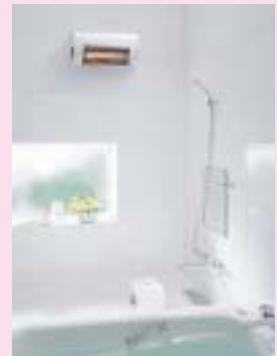
商品定価:128,000円(消費税別)