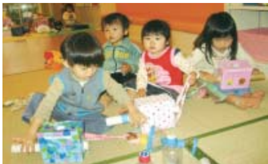
《手作りおもちゃで遊んでいる様子》

つどいのひろば ぽかぽかでは、就学前の乳幼児とその保護者が楽しく遊んでいます。ひろ～いお部屋で、ママごと遊びに、ブロック遊び、手作りおもちゃで遊んでみませんか？