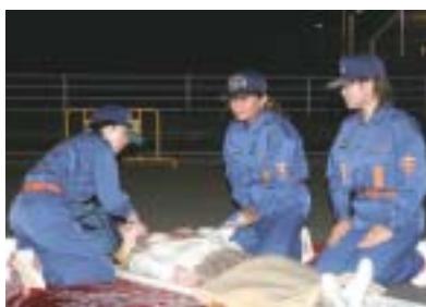
▲女性消防団員の訓練風景

消防団では、住民の生命、財産を守るため、災害に備えて装備の充実強化はもとより、団員の技術、おのび資質の向上を目的に訓練を行っています。