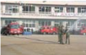
▲陸上自衛隊の展示訓練

式典終了後、陸上自衛隊小郡駐屯地音楽隊を先頭に、参加団体は小学校グラウンドから西鉄小郡駅まで市内パレードを実施しました。年頭の恒例行事に、沿道の市民らは足を止めて、規律正しい消防団員らの姿に、拍手を送っていました。