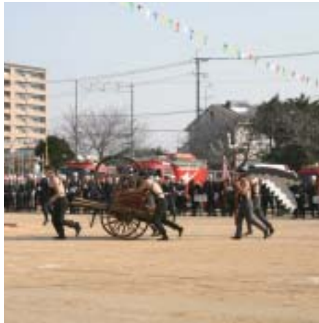
▲三井消防署による古式消防の展示