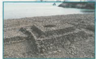
福岡県立歴史館 福岡県立歴史館 福岡県立歴史館