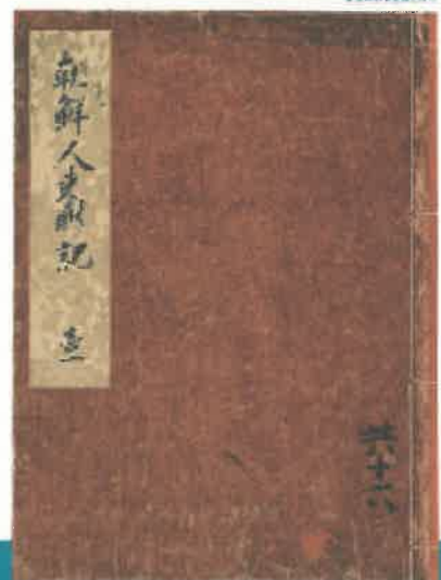
朝鮮人米徴収記 黒田家文書 小笠原文庫 福岡県立歴史館