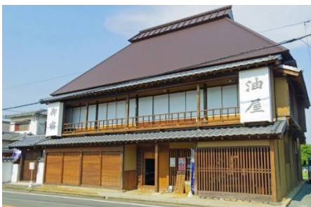
旧松崎旅籠 油屋（小郡市松崎786-1）