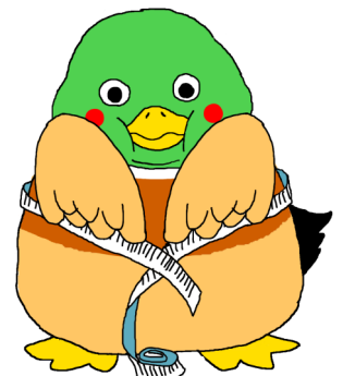
けんしんマスコット カモん君