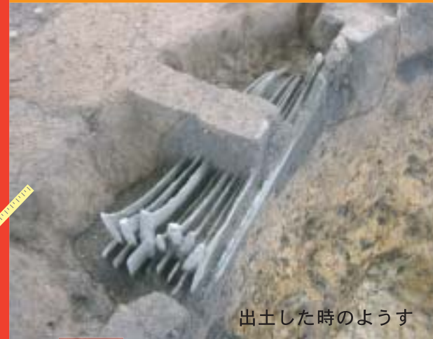
出土した時のようす