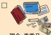
現金・貴重品身分証明書