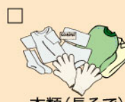
衣類(長そで)下着・くつ下