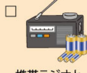
携帯ラジオと予備電池